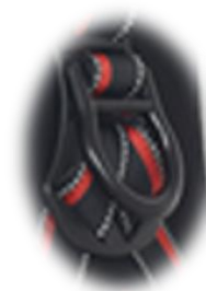
ARGOLA D-RING ALUMÍNIO