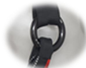
ARGOLA O-RING ALUMÍNIO